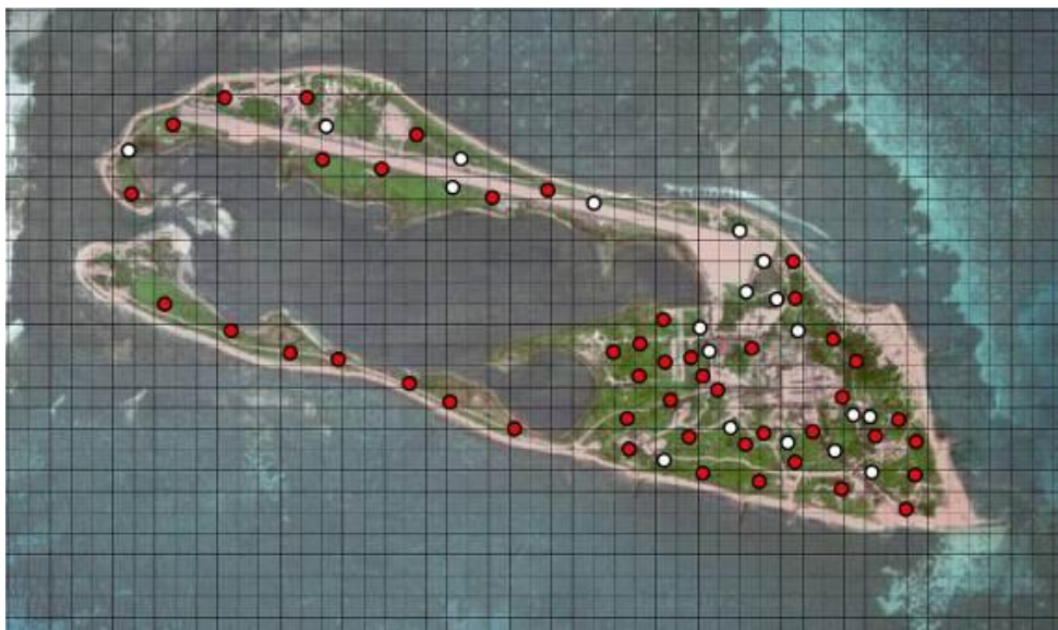
圖 2. 東沙島第 1-12 次白腹秧雞回播反應調查記錄整合圖，紅點表示有目擊到成對白腹秧雞活動或聽到成對白腹秧雞回應的位置，白點表示僅聽到或目擊到單隻白腹秧雞回應的位置，網格圖引用自李培芬等(2006)

在 E10 及 E6(圖 1)，此兩處皆為前一年即設置的固定式給水站，因此只有 4 台搭配移動式的給水站架設。一般白腹秧雞親鳥帶幼鳥出現在給水站時，都會停留一段時間，因此從攝影紀錄中能明確算出有多少隻幼鳥。一旦某監測站確定拍到白腹秧雞幼鳥，即將該攝影機移往下一個有白腹秧雞配對的樣點。至 11 月研究告一段落時，總共在 31 個樣點使用過自動攝影