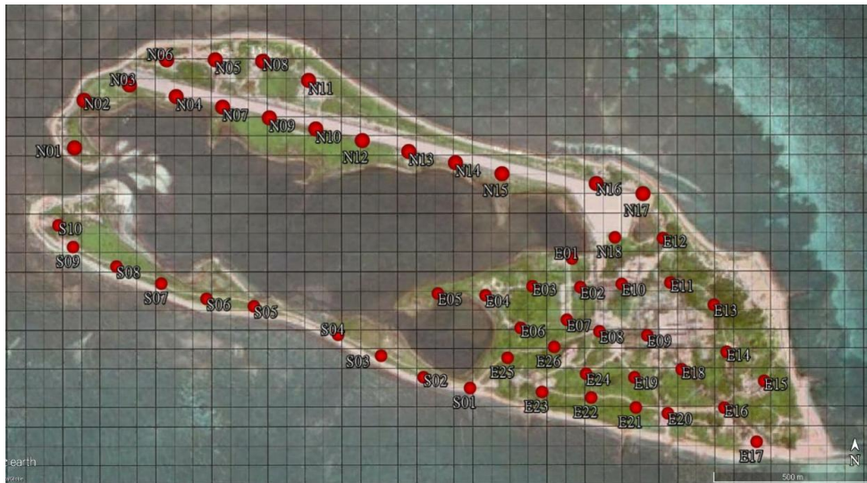
圖 1. 東沙島白腹秧雞回播反應調查播音點位置圖，數字編號前之英文字母表示區域，N 表北區，E 表東區，S 表南區，網格圖引用自李培芬等(2006)